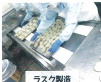
ラスク製造 (ライン作業)