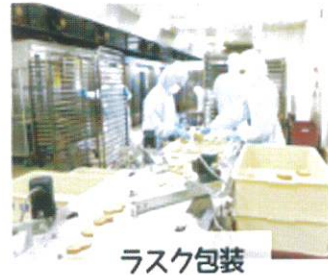
ラスク包装 (ライン作業)