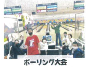
ボーリング大会 季節のイベントなど