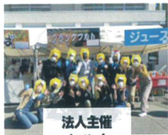
法人主催 イベント