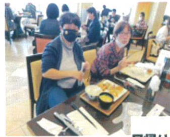
日帰り・宿泊旅行